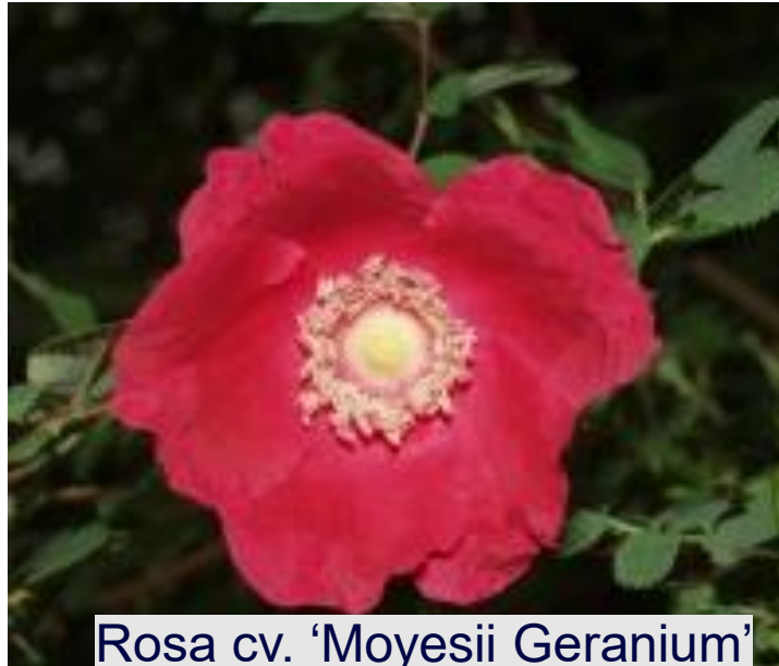
Rosa cv. 'Moyesii Geranium'