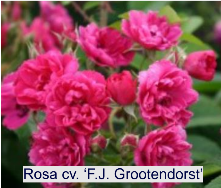
Rosa cv. 'F.J. Grootendorst'