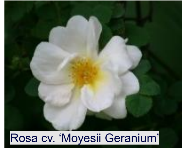
Rosa cv. 'Moyesii Geranium'